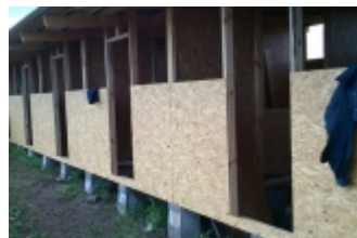
Летний сезонный павильон и холл для мероприятий